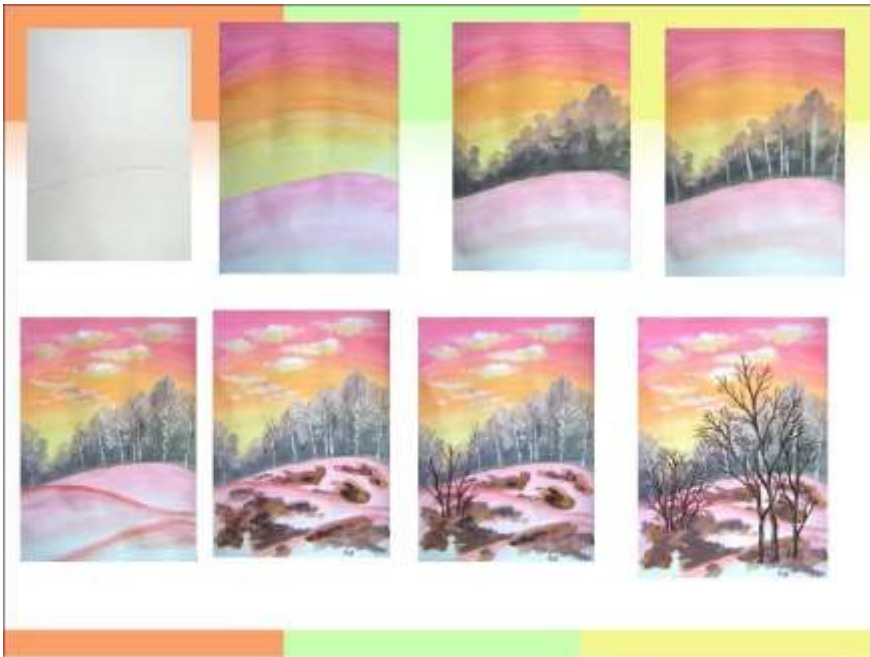
Примерные образцы весенних пейзажей.